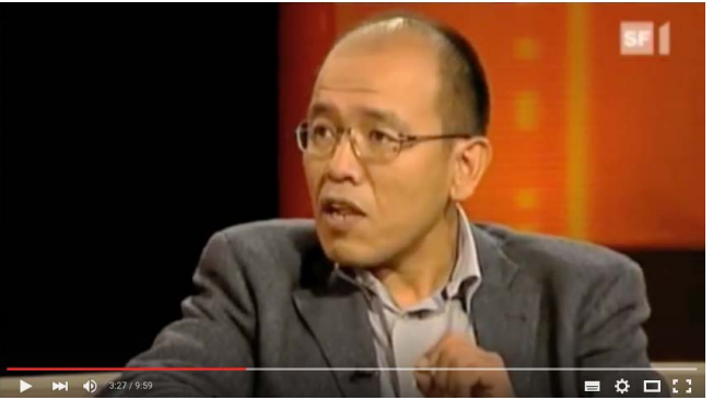
༢༠༠༩ སུད་སི་ ཤི་མེ་ནང་བོད་དོན་སྐོར་གསེབ་འགོལ་བྱེད་པ།

༢༠༠༢ — ༢༠༠༩ སུད་བོད་མཐུན་གྲོགས་ཚོགས་པའི་ཚོགས་གཙོ་དང་རྒྱན་ལས་ བྱས་བ་དང་། གཞི་རྒྱུ་སུད་བོད་མཐུན་ཚོགས་ཀྱི་ལས་དོན་ཚོགས་ཚུང་དང་དུས་ བཟུན་མཐུན་བསྐྱོད་ཡར་ཐོན་ཡོང་བ་སོགས་བཅོས་བསྐྱར་གྱི་ཐབས་ལམ་གསར་ གཏོད་དོན་སྤྱི་ལག་ལེན་སྐབས་སོགས་བྱུང་ཡོད། ༡༩༩༧ — ༡༩༩༩ ཡོ་རོབ་བོད་རིགས་གཞོན་ནུ་མཐུན་ཚོགས་ཀྱི་གསར་འཛིན་ ” བོད་ཀྱི་ན་གཞོན་ ” ཀྱི་ཚོམ་བྲིས་ཀྱི་འགན་འཁུར་བྱས་བ་དང་། གསར་འཛིན་དེའི་ བོད་སྐད་དང་འཇར་མན་གཉིས་ཀྱི་ནང་འབྲེལ་སྤེལ་བྱས་ཡོད།