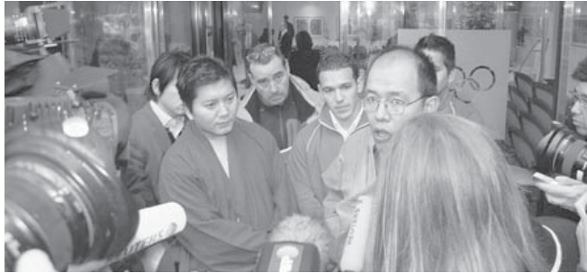
ལོ་སུན་ IOC ལས་ཁུངས་མཐུན་ལས་གསར་འགོད་ལྷན་ཚོགས།

ཀྱི་མཐུས་ཚབ་ཀྱི་རོ་བོ་ཐོག་ནས་བོད་དོན་བེད་དོན་མཐུན་ལུ་རྒྱ་དང་བོད་ཀྱི་གནད་དོན་ དེས་པར་དུ་ཐག་གཅོད་བྱས་རྒྱུ་མཐུན་འགྱུར་ཡོང་བའི་འབོད་སྐུལ་ལུ་ཡོད།