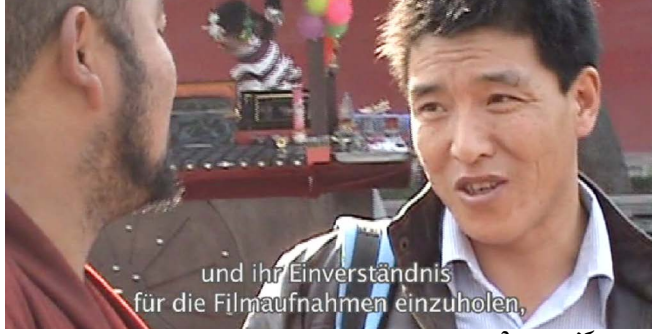
und ihr Einverständnis für die Filmaufnahmen einzuholen, འཛིགས་བྱེད་སྟེན་བརྟན་

འཛམ་གླིང་རྒྱལ་སྤྱིའི་བོད་དོན་རྒྱལ་སྐོར་ཚོགས་པའི་རྒྱན་ལས་དང་། ༢༠༠༩ ༢༠༠༧ བར་བོད་ཀྱི་ཚེད་མོའི་འགྲན་གྱི་ལས་དོན་ཚོགས་ཚུང་གི་འགོ་འཛིན་དང་ ༢༠༠༤ ལོའི་མེ་ཅིང་དུ་འཛམ་གླིང་ཚེད་མོའི་འགྲན་སྐབས་ཀྱི་བོད་དོན་ལས་འགུལ་ཚོགས་ཚུང་ཡོང་ སྤྱད་ལམ་སྟོན་བྱས་བ་དང་། ཚོགས་པ་ལག་ལ་འབྲེལ་མཐུན་དང་ལས་དོན་འཆར་ བཀོད་ཀྱིས་ལས་མགན་སོགས་བྱས་ཡོད། ༢༠༠༧ ལོ་སྐོར་ཁྲིམ་སྐུ་རྩེ་ལུ་ ཚོགས་པའི་བོད་དོན་ལས་འགུལ་ཚེན་མོ་གོ་ སྤྱིགས་ཀྱི་གཙོ་འགན་ལུ་བ། ༢༠༠༩ — ༢༠༠༩ འཇར་མན་འཛམ་གླིང་བོད་དོན་རྒྱལ་སྐོར་ཚོགས་པའི་རྒྱན་ལས་ བྱས་བ་མ་ཟད། སྐབས་དེའི་བོད་མིའི་རྒྱན་ལས་གཅིག་བུ་དེ་ཡིན་འདྲའོ་ཚོགས་པའི་ ལས་དོན་ཐག་གཅོད་ཅི་རིགས་ལ་མཉམ་ཞུགས་དང་རང་ཉིད་ཀྱི་ཤེས་ཡོན་དང་ ལུས་ལུགས་ཡོད་ཚད་བཏོན་ནས་ལས་དོན་འབྲེལ་ཤོར་མི་ཡོང་བའི་ཐུགས་འགན་གང་ ལེགས་བྱས་ཡོད།